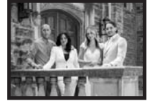
The Vescio Family